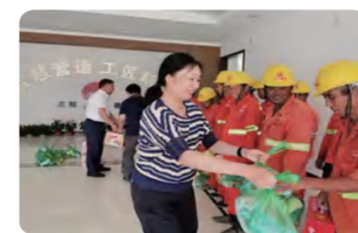
公司高温慰问物品