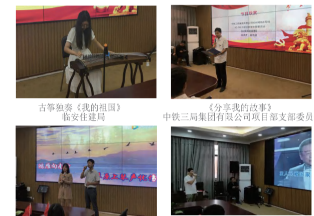
古筝独奏《我的祖国》 临安住建局

在比赛的间隙里，表演者们为大家带来了优美的歌曲、诗朗诵、沙画表演、小故事分享及琴声婉转的古筝表演，形式不拘一格，展现内容丰富多彩，表达感情真诚深厚，是我们城建人热爱祖国的真实体现。参赛者们沉浸在音符中，舒缓了紧张的比赛气氛。