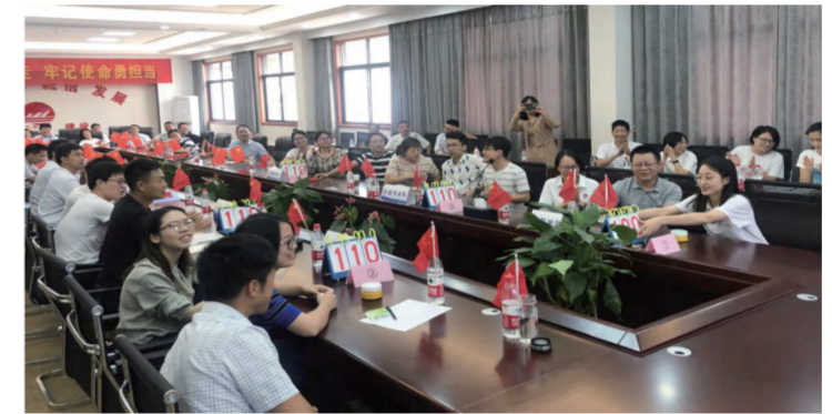
工程冲锋队抢答成功并获得加分

比赛分为四个部分，分别为必答题、抢答题、风险题以及挑战题。抢答题环节战况最为激烈，不仅是各队人马抢答题速度的比拼，更是大家对党的知识储备是否充足的考验。